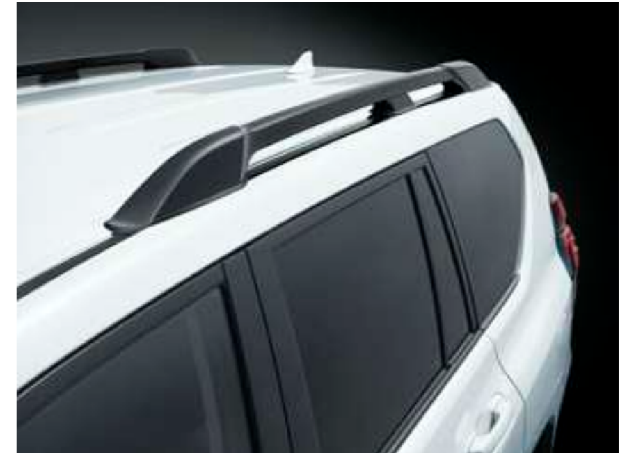
ルーフレール [ブラック]