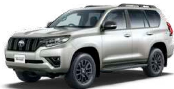
アバンギャルドブロンズメタリック〈4V8〉

*1.ボディカラーのホワイトパールクリスタルシャイン〈070〉はメーカーオプション<33,000円(消費税抜き30,000円)>となります。 ■写真はすべて特別仕様車 TX“Lパッケージ・Matt Black Edition”(2.7Lガソリン車7人乗り) [ベース車両はTX(2.7Lガソリン車7人乗り)]。オプション装着車。 ※マルチテレインモニターを装着しているため、補助確認装置(2面鏡式)が非装着となっています。 ■価格はメーカー希望小売価格<(消費税10%込み)'22年8月現在のもの>で参考価格です。価格は販売店が独自に定めていますので、詳しくは各販売店におたずねください。 ■「メーカーオプション」はご注文時に申し受けます。メーカーの工場では装着するため、ご注文後はお受けできませんのでご了承ください。 ■ボディカラーおよび内装色は撮影および表示画面の関係で実際の色とは異なって見えることがあります。また、実車においてもご覧になる環境(屋内外、光の角度)により、ボディカラーの見え方は異なります。