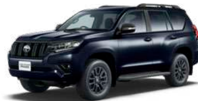
アティチュードブラックマイカ〈218〉