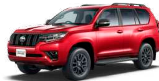
レッドマイカメタリック〈3R3〉