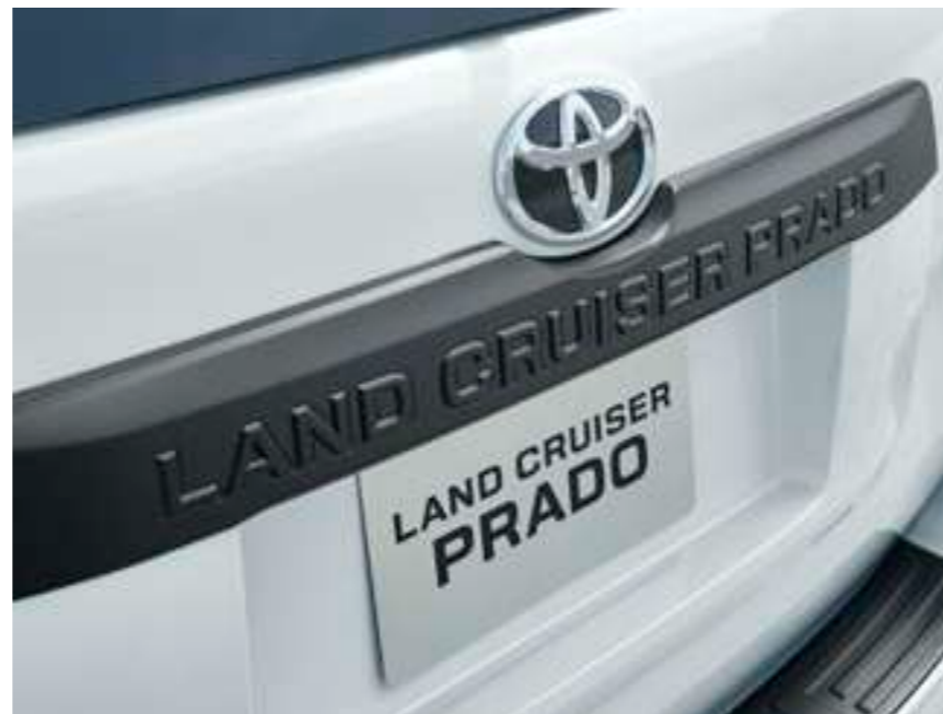
バックドアガーニッシュ [マットブラック塗装]