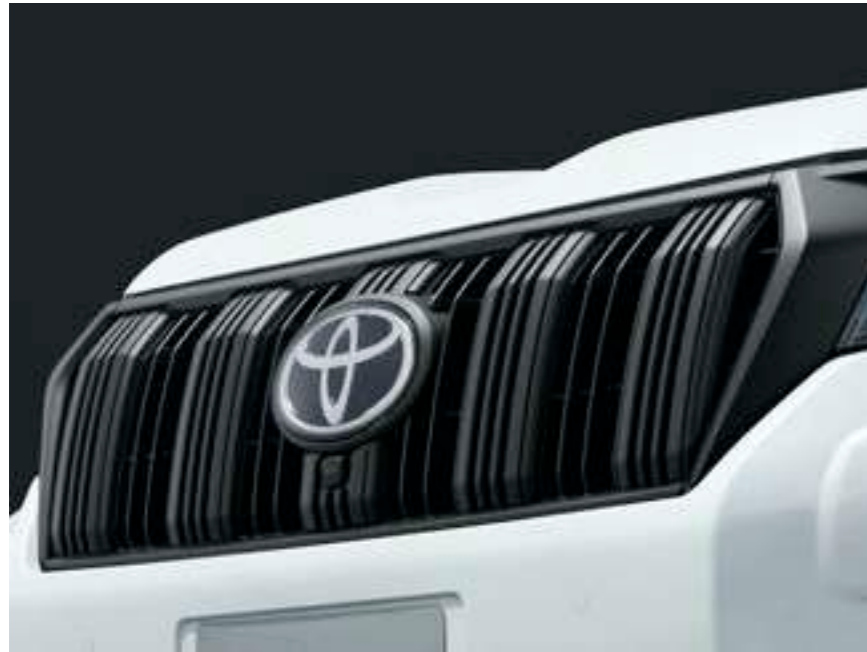
ラジエーターグリル [マットブラック塗装] & グリルインナーバー [マットブラック塗装]