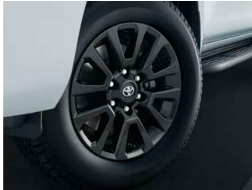
265/60R18タイヤ & 18×7½Jアルミホイール [マットブラック塗装]