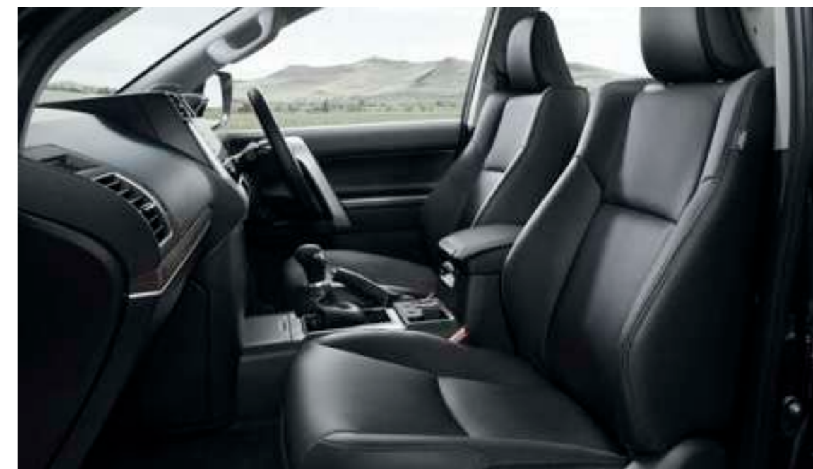
Photo①：特別仕様車 TX“Lパッケージ・Matt Black Edition”（2.7Lガソリン車7人乗り） [ベース車両はTX（2.7Lガソリン車7人乗り）]。ボディカラーはブラック〈202〉。内装色はブラック。オプション装着車（詳細は右上に記載の詳細ページへ）。

華美ではない。けれど、 静謐さを生む機能美に包まれて、 小さな心の動きさえも逃さずに。 少しずつ増えていく思い出たちを くり返し噛み締め、楽しみながら帰路につく。