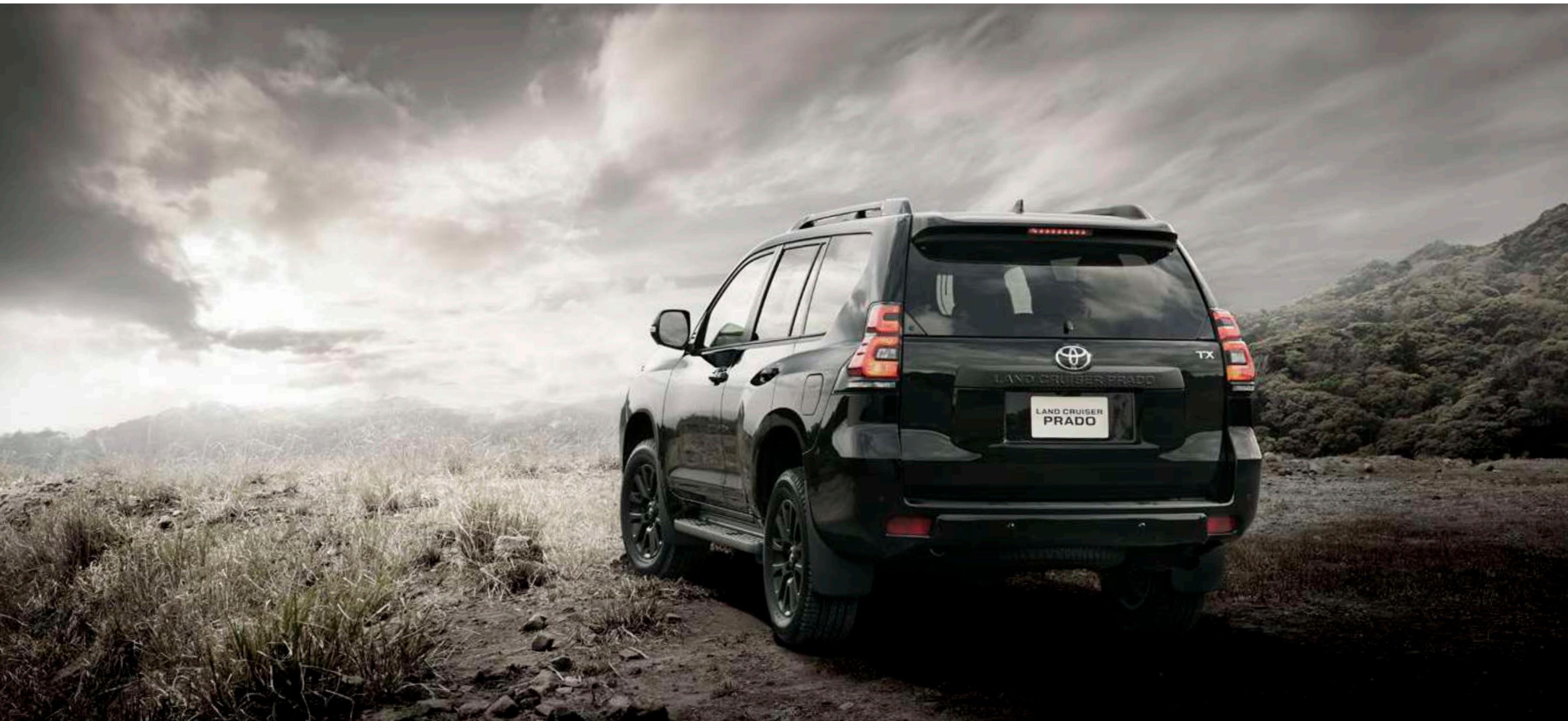
Photo①：特別仕様車 TX“Lパッケージ・Matt Black Edition”（2.7Lガソリン車7人乗り） [ベース車両はTX（2.7Lガソリン車7人乗り）]。ボディカラーはブラック〈202〉。内装色はブラック。オプション装着車（詳細は右上に記載の詳細ページへ）。