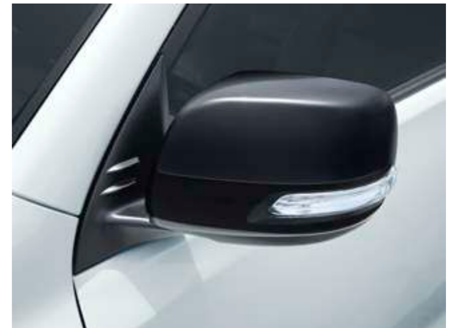
サイドターンランプ付オート電動格納式リモコンドアミラー [マットブラック塗装]