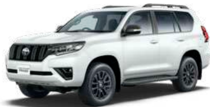
ホワイトパールクリスタルシャイン〈070〉 [メーカーオプション] *1