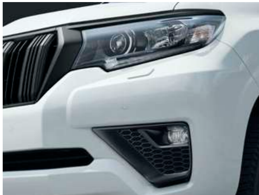
LEDヘッドランプ（オートレベリング機能付） [ブラックエクステンション] /ヘッドランプガーニッシュ [マットブラック塗装] /専用フォグランプベゼル [マットブラック塗装]