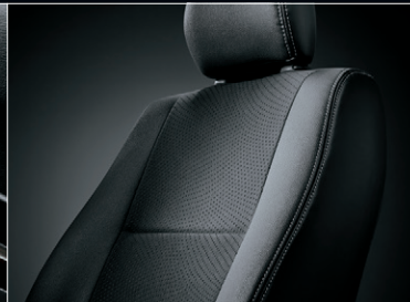
■ シート表皮:トリコット+合成皮革& ダブルステッチ(ダークグレー)