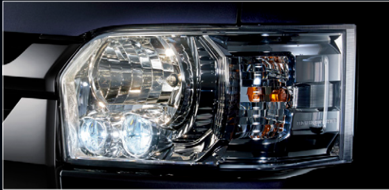
■ LEDヘッドランプ(クリアスモーク加飾)