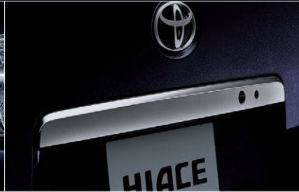
■ メッキバックドアガーニッシュ(ダークメッキ)