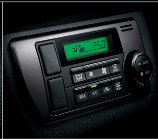
■ フロントエアコンプッシュ式コントロールパネル (ダークシルバークラッシュ)