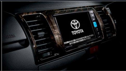
■ インstrumentパネルアッパー部(黒木目マホガニー調加飾) ※写真の7インチベシクナビは販売店装着オプション。