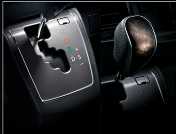
■ シフトベゼル(ダークシルバークラッシュ) ■ シフトノブ(本革+黒木目マホガニー調加飾)