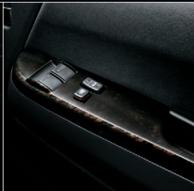
■ フロントドアトリム(合成皮革) ■ パワーウィンドウスイッチベース (黒木目マホガニー調加飾)