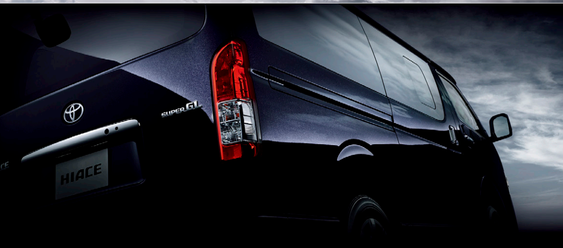
Photo:特別仕様車スーパーGL“DARK PRIME II”(2WD・2800ディーゼル・標準ボディ)[ベース車両はスーパーGL(2WD・2800ディーゼル・標準ボディ)]. ボディカラーの特別設定色スパークリングブラックパールクリスタルシャイン<220>はメーカーオプション。

ダークな色調で統一されたインテリア、 存在感あるスタイル。さらには、高い安全性へのこだわり。 大人を満足させる質感とシックな輝きに満ちた 特別なハイエースがここに。