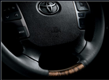
■ 4本スポークステアリングホイール (本革巻き+黒木目マホガニー調加飾)