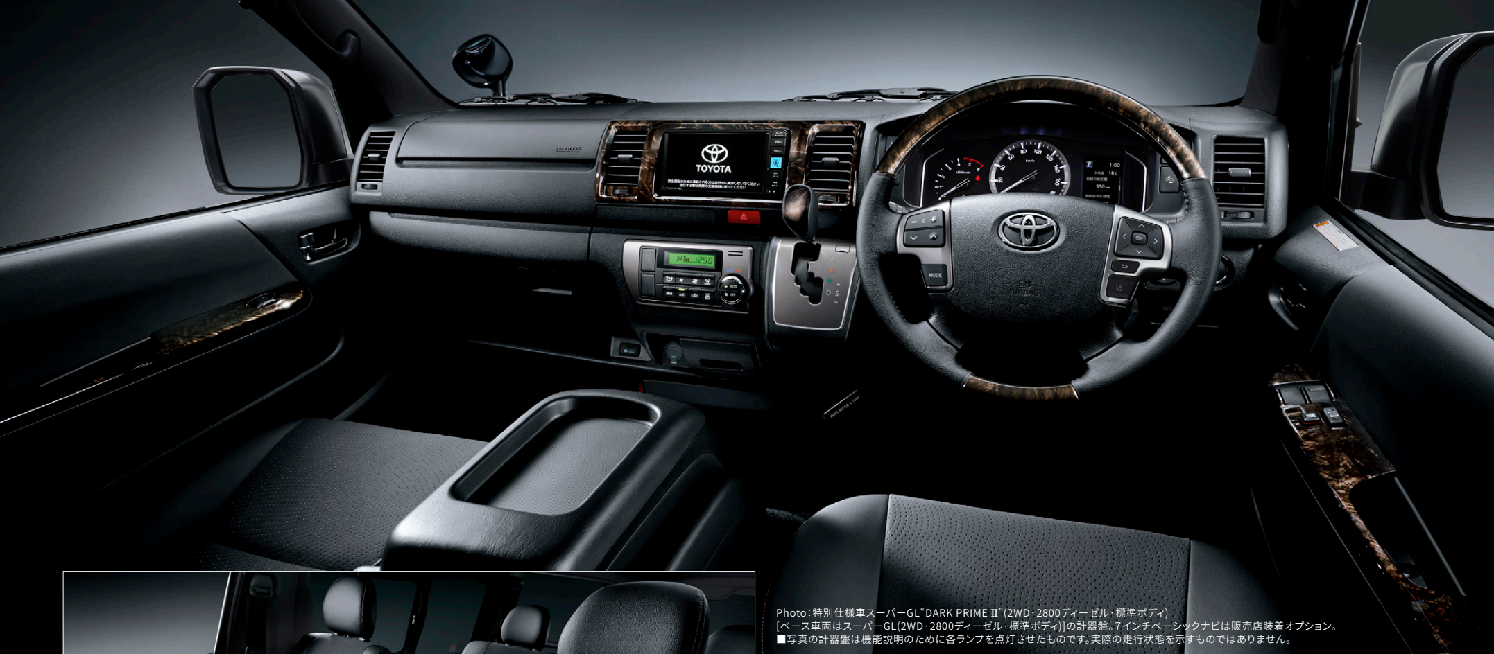
Photo:特別仕様車スーパーGL「DARK PRIME II」(2WD・2800ディーゼル・標準ボディ) [ベース車両はスーパーGL(2WD・2800ディーゼル・標準ボディ)]の計器盤。7インチタッチナビは販売店装着オプション。 ■写真の計器盤は機能説明のために各ランプを点灯させたものです。実際の走行状態を示すものではありません。