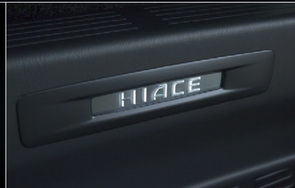
■ スライドドアスカッフプレート (車名ロゴ&イルミネーション付)