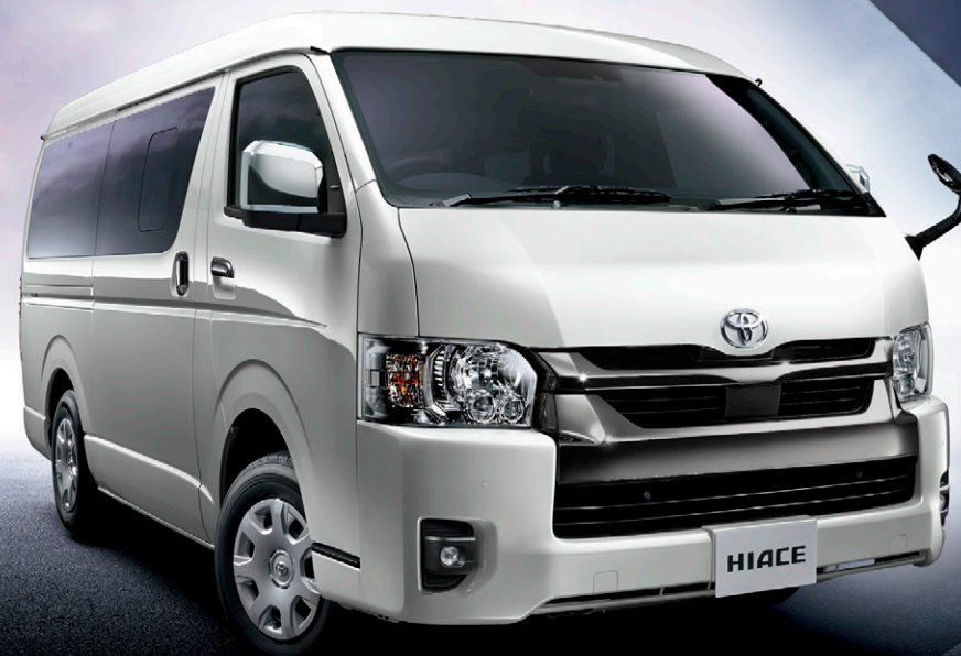
Photo:特別仕様車スーパーGL“DARK PRIME II”(2WD・2800ディーゼル・標準ボディ) [ベース車両はスーパーGL(2WD・2800ディーゼル・標準ボディ)]。 ボディカラーの特別設定色スパークリングブラックパールクリスタルシャイン<220>はメーカーオプション。