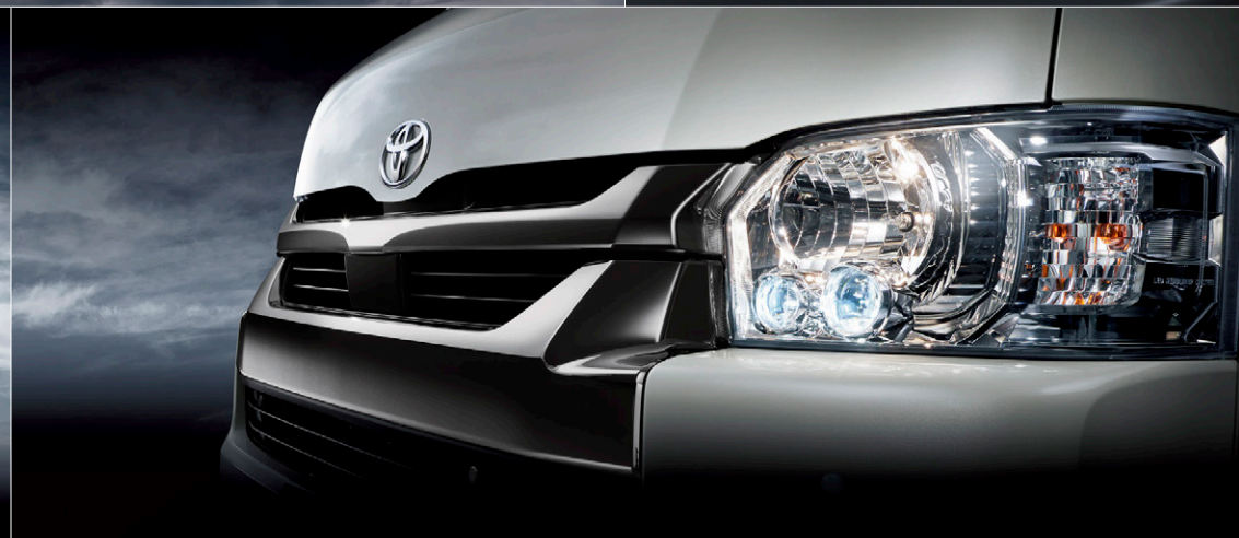
Photo:特別仕様車スーパーGL“DARK PRIME II”(4WD・2700ガソリン・ワイドボディ)[ベース車両はスーパーGL(4WD・2700ガソリン・ワイドボディ)]. ボディカラーのホワイトパールクリスタルシャイン<070>はメーカーオプション。