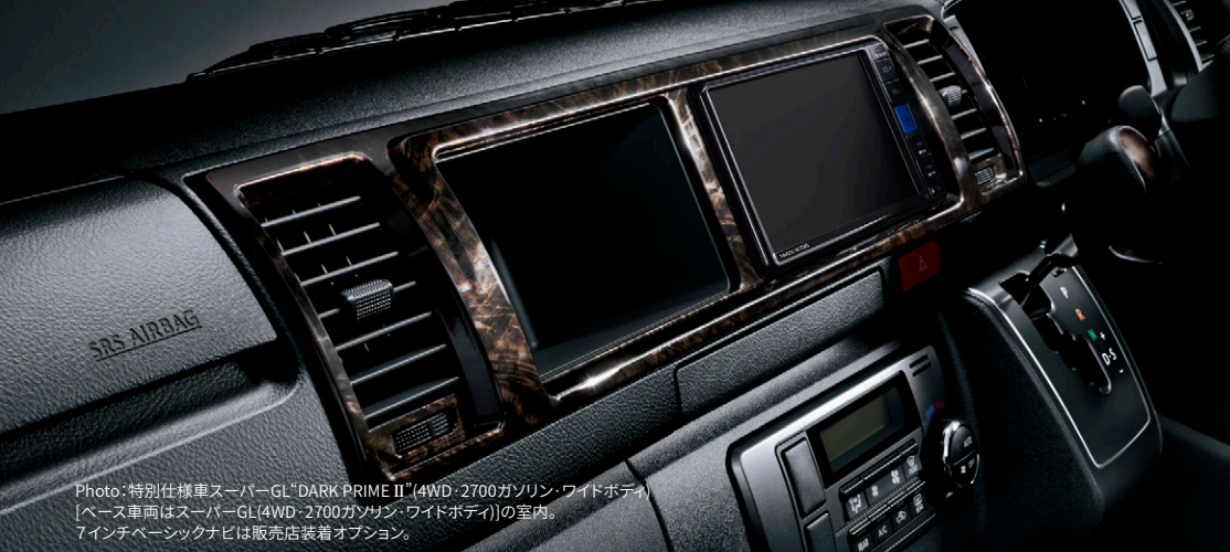
Photo:特別仕様車スーパーGL“DARK PRIME II”(4WD・2700ガソリン・ワイドボディ) [ベース車両はスーパーGL(4WD・2700ガソリン・ワイドボディ)]の室内。 7インチタッチナビは販売店装着オプション。