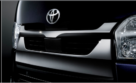
■ メッキフロントグリル(ダークメッキ)