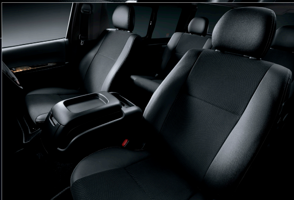
Photo:特別仕様車スーパーGL「DARK PRIME II」(2WD・2800ディーゼル・標準ボディ)[ベース車両はスーパーGL(2WD・2800ディーゼル・標準ボディ)]の室内。