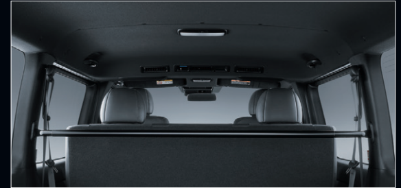
■ ルーフ&ピラー(ブラック)