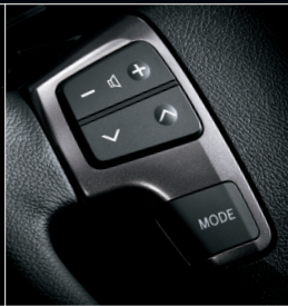
■ ステアリングスイッチベゼル (ダークシルバークラッシュ)