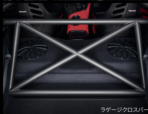
ラゲージクロスバー