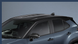
▶ツートーンルーフ(ブラック)