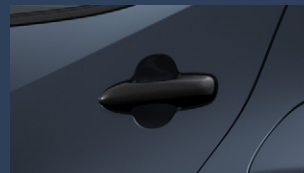
▶アウトサイドドアハンドル (ブラック)