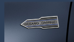
▶フェンダーエンブレム