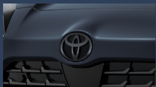
▶トヨタマーク (ブラック/フロント・リヤ)