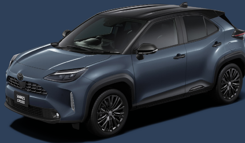
ブラックマイカ(209)×マッシュグレー(1L6) [M23]