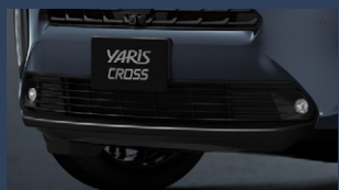
▶LEDフロントフォグランプ