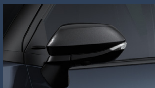
▶LEDサイドターンランプ付オート 電動格納式リモコンドアミラー (ブラック/ヒーター付)