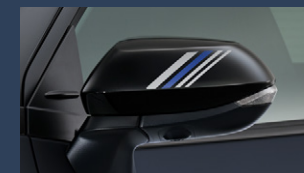
▶ドアミラーステッカー

※ステッカー周辺への高圧洗浄は行わないで ください。ステッカー剥がれの原因となります。