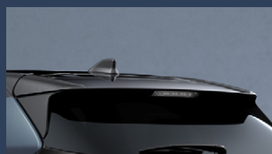
▶リヤルーフスポイラー(ブラック)