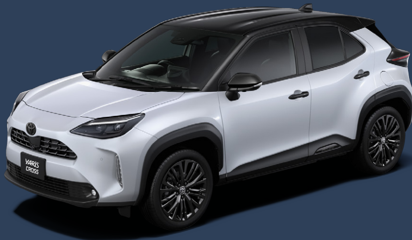
ブラックマイカ(209)×プラチナホワイトパールマイカ(089) [2PU]

軽やかなホワイトと、シックなグレー。ルーフのブラックと融合する、都会的な2色をご用意。