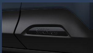
▶サイドオーナメント(ブラック)